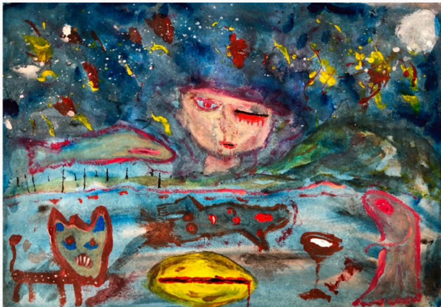
Yuval Avital, Silent Night , 2018, tecnica mista su carta, 42 x 59,4 cm